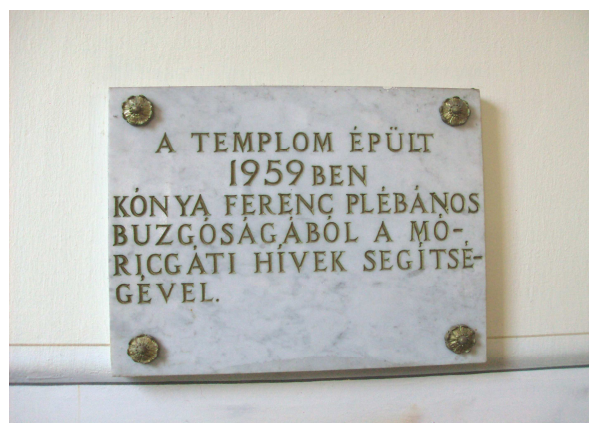
Emléktábla a templomban.

hordták a téglát a vagonokból, oltották a meszet, végeztek minden segédmunkát. A dolgozóknak minden nap másik családnál főztek ebédet.